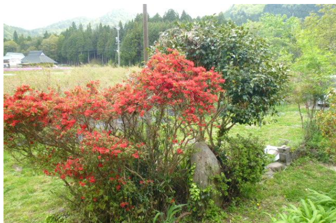
農園の庭の真っ赤なキリシマツツジが咲きだした。