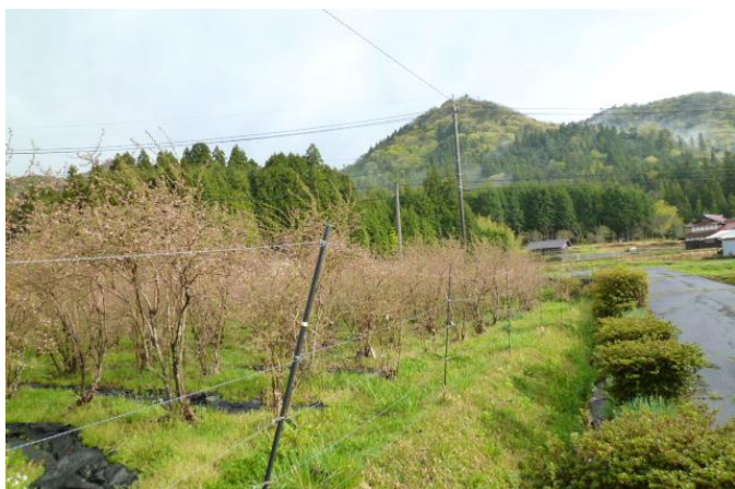
結局雨が降ったりやんだり、帰るころには日がさしたりの気まぐれ天気になり回されてしまった。