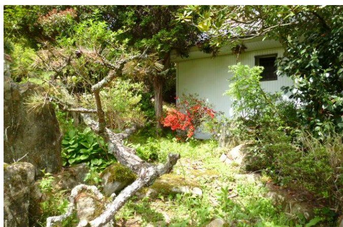
蔵の後ろの庭にもちょこっと咲いている。