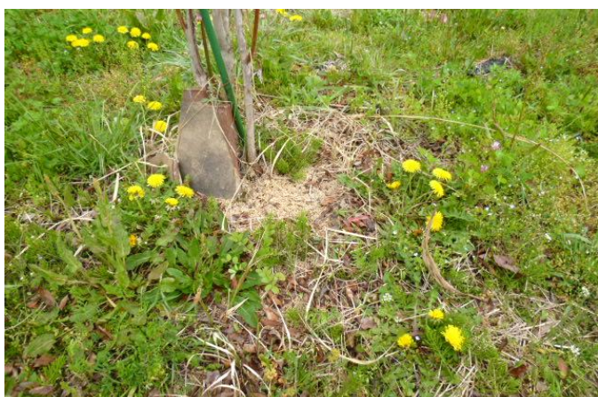
ブルーベリー畑のタンポポ。今年は花が多いようだ。